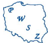
Komisja Państwowych Wyższych Szkół Zawodowych