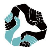
Komisja Uczelni Wychowania Fizycznego