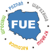
Forum Uczelni Ekonomicznych