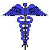
Komisja Wyższego Szkolnictwa Medycznego